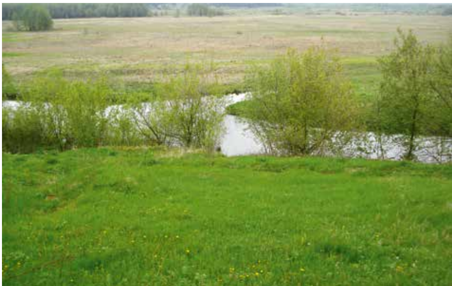
Река Илѣк близ с.Вишнево