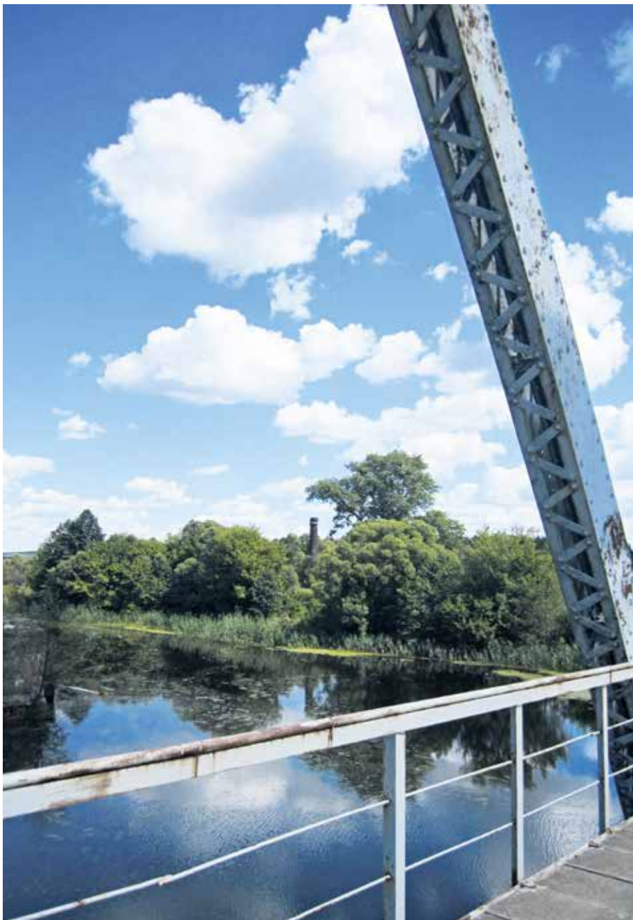
Вид на реку Псёл с железнодорожного моста

Вероятно, исток в какие-то времена находился на никем не занятой земле; теплый, студёный, холодный – по качеству воды; Жилин – патронимическое определение; Неведомый, то есть неизвестный. Долгий Колодезь – это Долгий ручей.