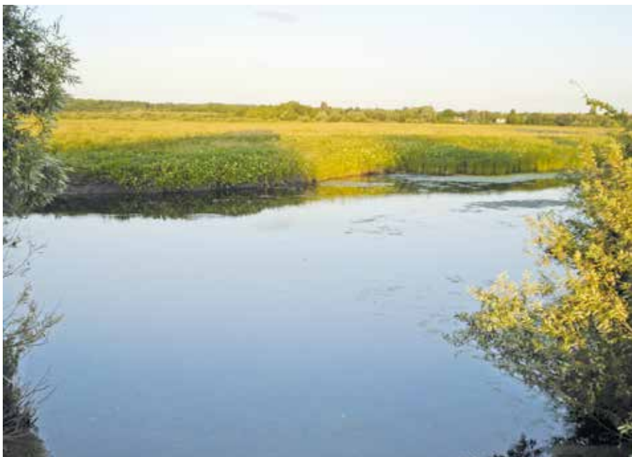
Река Илѣк близ с.Вишнево