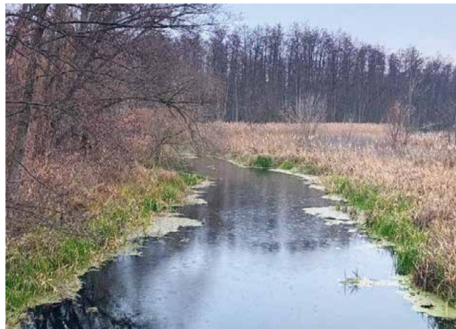
Река Бобрава близ хутора Пенского.