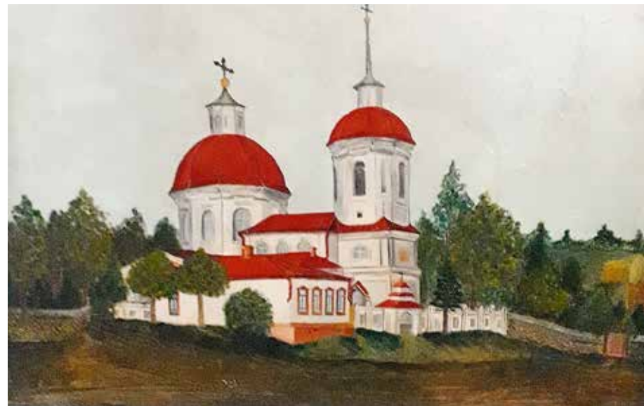
Храм в селе Знаменское (ныне не существует)