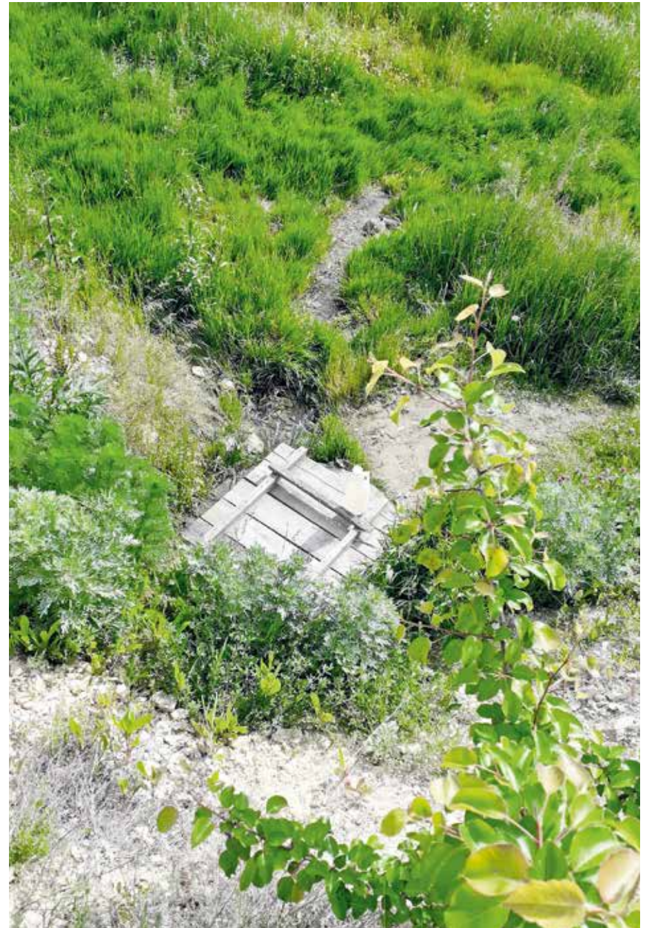
Исток реки Белица.с Малый Каменец