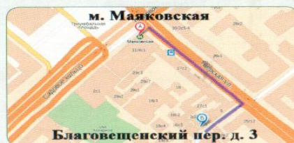
Прием документов м. Маяковская, Благовещенский пер., 3

Юридический адрес: 123001, г. Москва, ул. Б. Садовая, 14 Сайт Военного университета: www.vumo.mil.ru